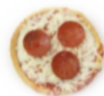
Turkey Pepperoni Pizza