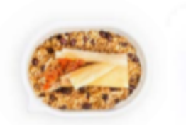
Red Chile Chicken Tamale