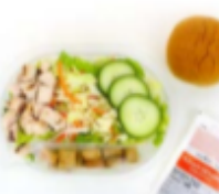
Sesame Chicken Salad