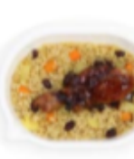
Jerk Chicken Drumstick