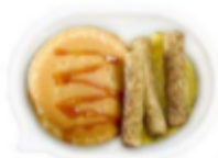
Buttermilk Pancakes, Sausage & Omelet